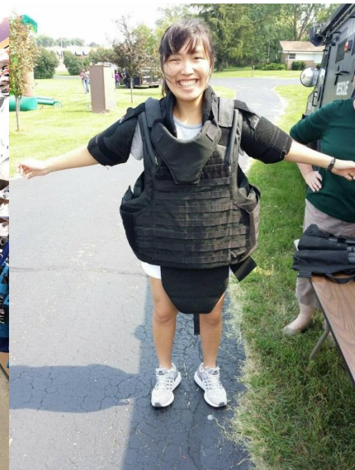
體驗整套霹靂小組防彈背心