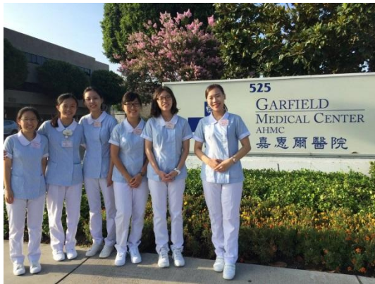
於洛杉磯嘉惠爾醫院見習

此外，美國醫院有很多專門技術的人，像是有翻身員、on IC的人員、專門換藥的人員等等，這樣會讓護理師的工作量比較少，比較可以專心注意在寫紀錄上面及主動關心病人和他們會談等等，而且美國的護病比約是1:3~1:5，跟台灣的護病比真的差很多，不只是這樣，他們的醫院最多只有兩人房，不像台灣健保床可以住到四人房，也許是美國人比較注重隱私，而且他們的復健中心有專門的實體東西讓你去試，像是學習搭公車就真的有公車實體模型，煮飯也有廚房的實體模型等等，這些是最主要和台灣有差異的。美國護理師自己營業的診所或是幫助弱勢的機構等等都是從源頭做起，我覺得這是台灣必須學習的地方，就像是台灣的衛生所都會衛教民眾怎麼吃，像是有三高就不可吃太甜太鹹太油膩的食物，但在美國會提供你如何吃得健康，會自己找食材、食譜，給你這份食物再跟你說如何烹調，這才是從源頭做起，而不是只會說的好聽而已，不只是這樣，如果跟員工說要活得健康，還會提供健身房供你運動，而不是只說表面而已，我覺得這是台灣還有很大進步的空間。