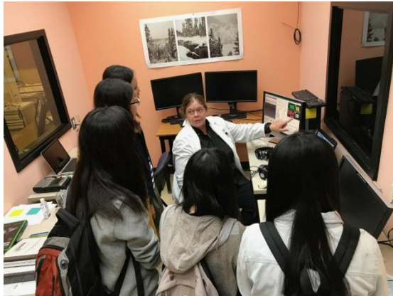
教導技術考時指導官如何監測學生