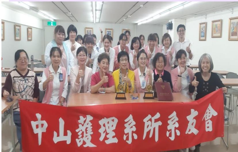
2021校友總會及護理系所系友會