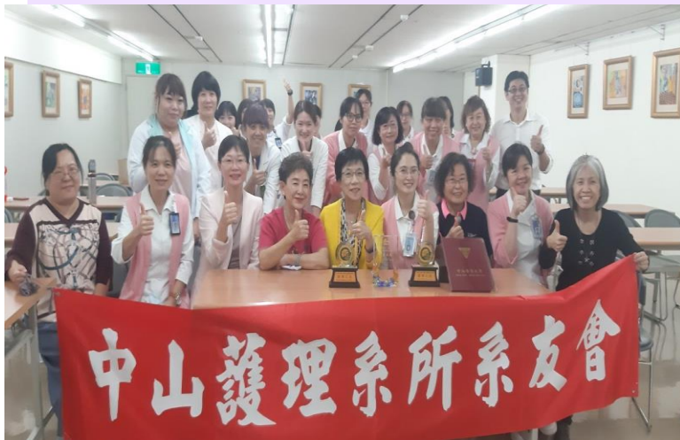
2021校友總會及護理系所系友會